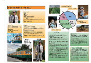
「地域を支える仕事人の図鑑 Vol.2」

ドル」の製作をしています。アイスキャンデルの製作には、地域の皆さんにも協力してもらい、温かい炎で幻想的な世界を演出します。