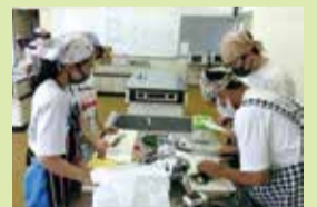
試作品づくりの様子(白根北中)