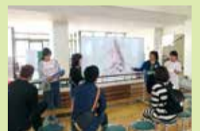
昨年度の水防災安全マップの提案発表(味方小)

来校の際は自宅での検温やマスクの着用をお願いします。また感染拡大の状況によっては、内容の変更や中止もあります。参観の際は各学校または南区教育支援センターへ確認をしてください。