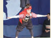
唐子人形お馬乗り