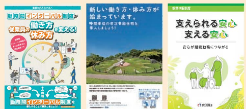
各制度に関するリーフレット(例)

「勤務間インターバル制度」「時間単位の年次有給休暇制度」「特別な休暇制度」などについて、企業の取組事例の紹介や、リーフレットなどの資料を掲載しています。自社における制度検討の参考にご活用ください。