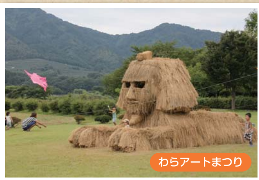
わらアートまつり