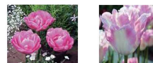
こしらんまん 越爛漫