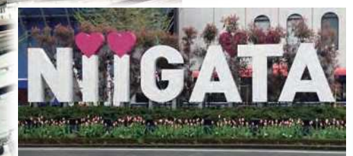
新潟駅前のNIIGATAオブジェも チューリップの植え込みで春らしく。