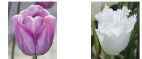
ゆきむらさき 雪紫