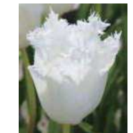
ゆきのはな 雪の花