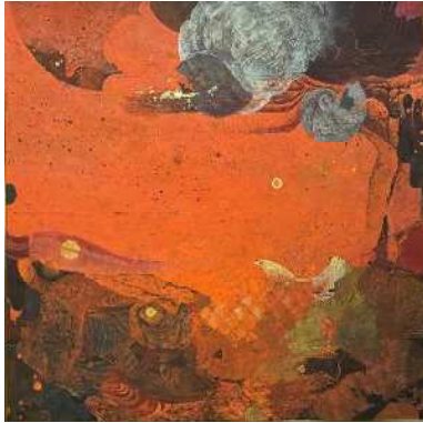
樋口峰夫画《澁み》(巻郷土資料館蔵)