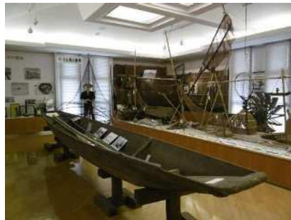
鍮潟の民具(新潟市潟東歴史民俗資料館蔵)