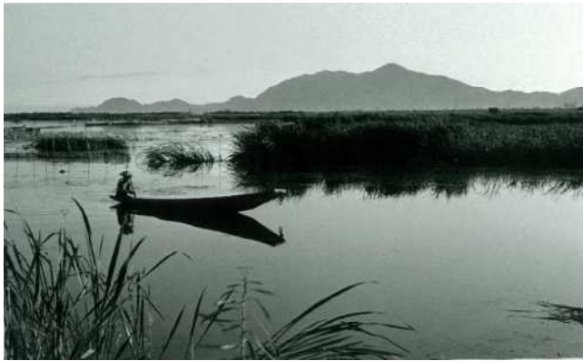
古俣近建《弥彦山に見える風景》(『ありし日の鍮潟』より)

「夏の鍮潟は子ども天国である。蓮の花を手折り、その実をとり、水浴みに興ずる。(天竺堂排水機付近)」石山与五栄門『鍮潟』より