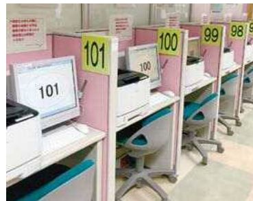
求人検索コーナー

子どもの遊べるキッズコーナーもあり、おもちゃや絵本、DVDが用意されています。月～金曜日10時～15時は、安全サポートスタッフがお子さんを見守るお手伝いをしています。(託児ではありません)