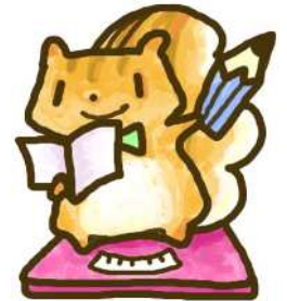
推進キャラクターはかりすくん