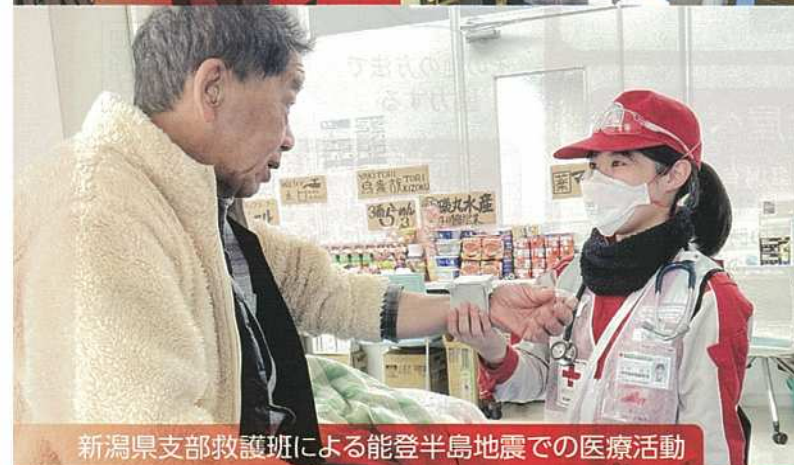
新潟県支部救護班による能登半島地震での医療活動