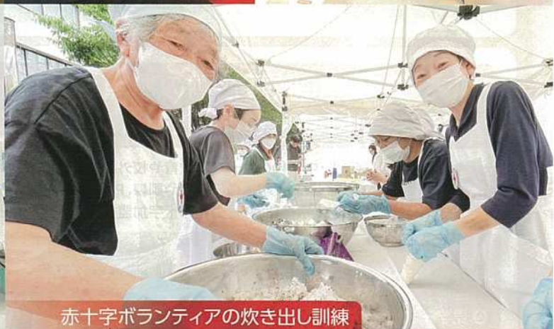
赤十字ボランティアの炊き出し訓練