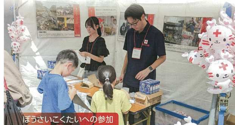
ぼうさいくたいへの参加