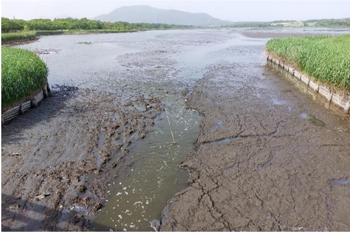
↑ 佐潟橋から佐潟（下潟）を望む