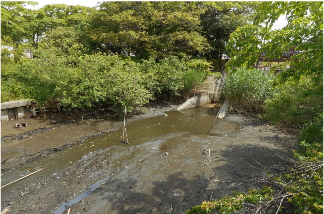
↑ 佐潟橋から水門を望む