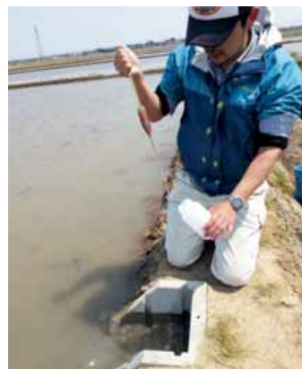
田んぼの水のサンプリング (2014年4月、新潟市東区にて)

一方、田んぼダムは、協力農家がメリットを感じられないのが普及に向けた大きな課題です。現在、田んぼダムの水田土砂流出抑制効果に着目して、調査・分析を実施しています。田んぼダムが、水田からの肥沃な土の流出を抑えることに効果があれば、農家のメリットになる上、河川や潟などの水質汚濁の軽減、土砂の堆積による治水機能の低下を抑えられるのではないかと考えています。