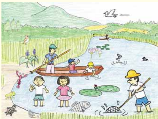
イラスト：太田和宏