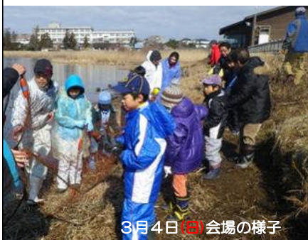
3月4日(日) 会場の様子

お天気も良く、会場は大賑わい。引き網体験では大きなコイがかかり、歓声があがりました。コイ汁などの飲食テントや、佐潟の魚や地域の野菜などの販売も大盛況だったようです。