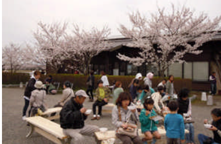
4月22日(日) 会場の様子

当日は風が強く一部プログラムを変更したものの、たくさんの方々にご来場いただきました。ライトアップも行なわれ、水辺に浮かぶ夜桜も楽しむことが出来ました。