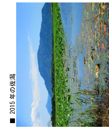
2015年湖面にハスのある佐潟