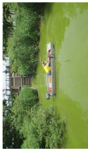
一面アオコだけの佐潟橋から水門付近 (2018.7.6)