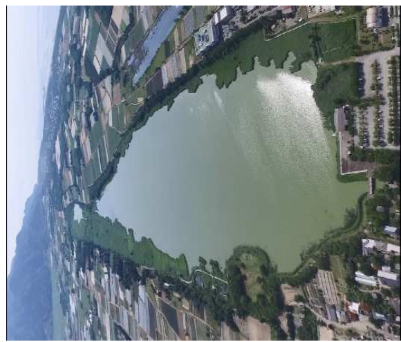
2018年7月 湖面には何もなく青みがかった佐潟