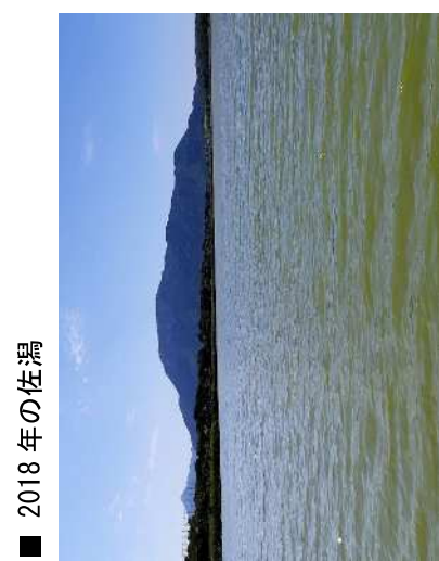
2018年 湖面には何もない佐潟