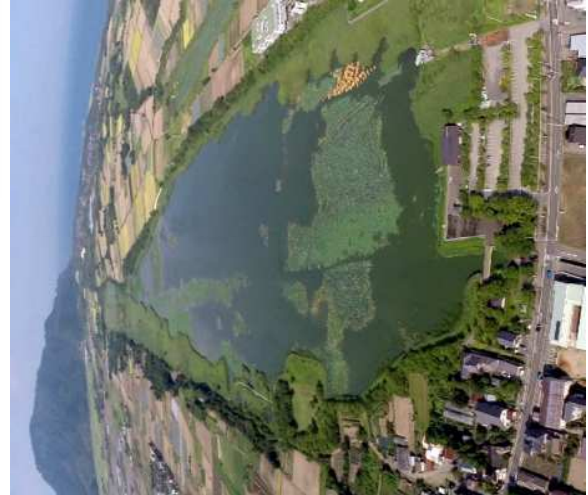
2015年7月 まだ多くのハスが広がる佐潟