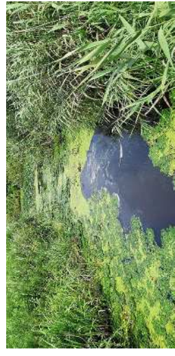
2018年上潟と下潟を結ぶ水路にもアオコが