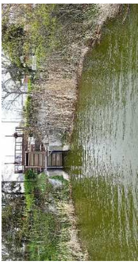
2015年、若干アオコ発生の水門付近