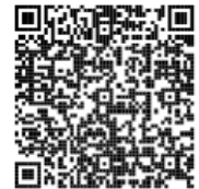
新潟市 HP (常時募集・特別募集)