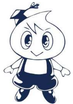
新潟市水道局 マスコットキャラクター 水太郎