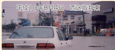
平成10年8月4日 西区坂井東

新潟市では床上浸水など被害の大きかった地域について 10 年に一度の確率で降る雨の強さ（概ね 1 時間当たり約 50 ミリ）をもとに下水道施設の整備を進めています。