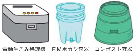
電動生ごみ処理機 EMボカシ容器 コンポスト容器

生ごみ減量の講座も開催しています！ 今後の市報にいがたをチェックしてくださいね♪