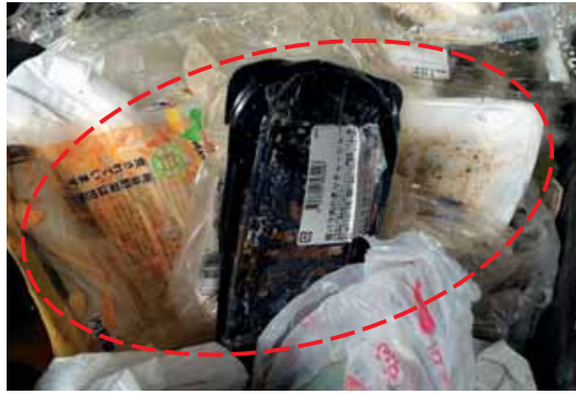
汚れたまま出されている例 ※きれいに出されたものまで汚してしまいます。

食べ物などが残った汚れのひどいものは、きれいにして出されていくものまで汚してしまい、その結果、資源としてリサイクルすることが