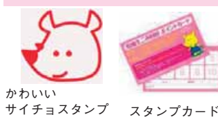
かわいいサイチョスタンプ スタンプカード

乾燥生ごみ1kgにつきカードにスタンプ1個押印。スタンプ10個で、新潟市共通商品券500円分を進呈(後日郵送)。 ※乾燥生ごみ持込1回につき「にいがた未来ポイント」を50ポイント交付します。