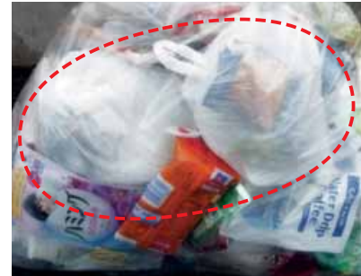
袋の中に小袋を入れないでください。(二重袋にしないでください)