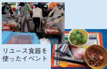
リユース食器を使ったイベント