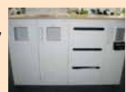
分別に応じたごみ箱の配置