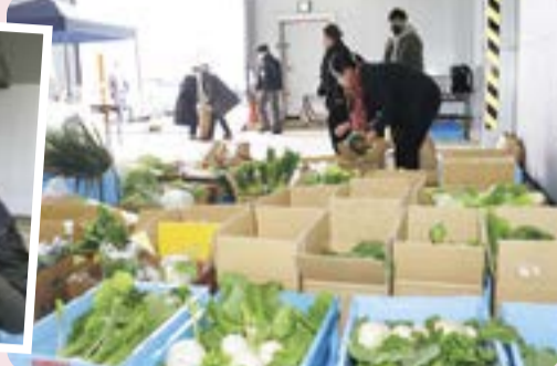
子ども食堂の方が野菜を持ち帰る様子