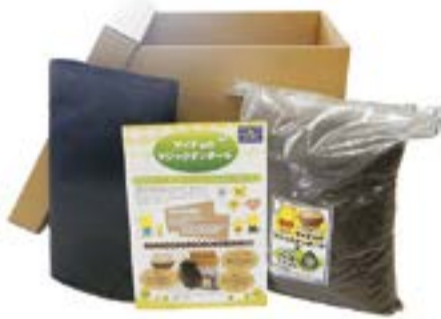
サイチョのマジックダンボール(セット)