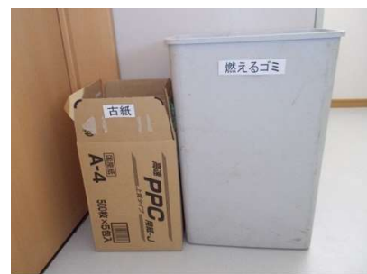
・休憩や打合せに使われるスペースでは、再生紙と燃えるゴミ、ペットボトルのキャップなどを分別