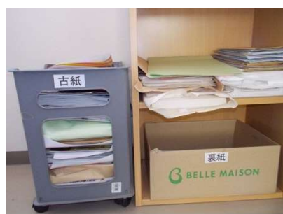
・古紙、再生紙は分別して管理