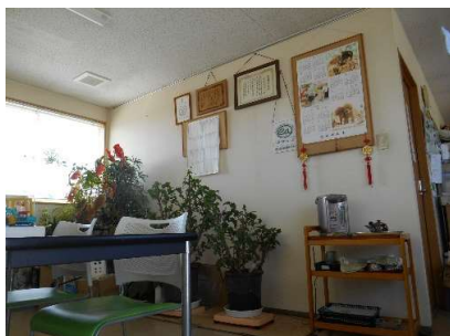
・社内の対応スペースから見える各種表彰状