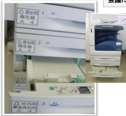
コピー用紙には、再生紙 or 裏紙再 利用を使い分け