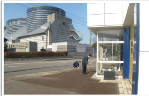
毎週月曜日は「社屋周辺清掃活動の日」