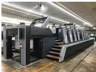
LED-UV印刷で、使用エネルギーを抑えた高生産な印刷を実現