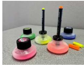
文具等の使い捨て削減