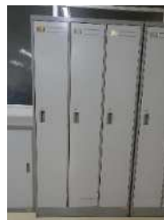
不要備品の再利用

職員の昼食時に使用する箸はリユース箸の使用を推奨し、割り箸等の使い捨て箸製品を削減しています。お茶を飲む時は湯呑茶碗を使用し、リユースしています。蛍光ペン等はインキが無くなったら補充して都度廃棄せずに継続して使用しています。