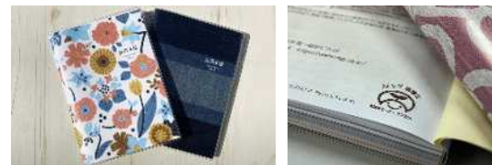
自社製品にカーボンオフセットのマークを表示