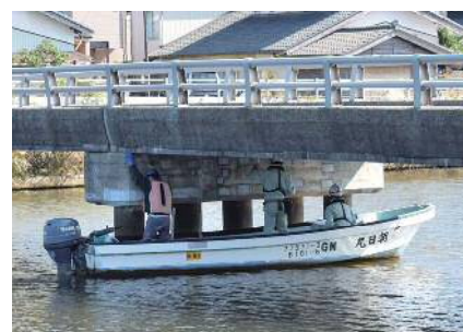
橋りょう点検の様子