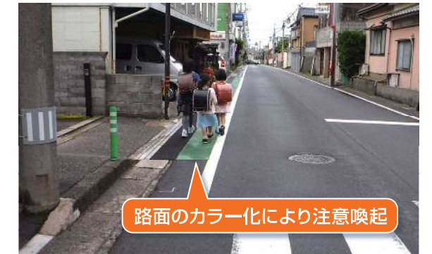
路面のカラー化 (西区・青山小学校)