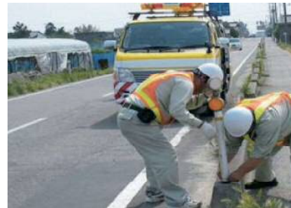
道路施設の維持管理の様子

現在、新潟市が管理をしている道路は国県市道あわせて7,000km近くとなっています。これらの道路を常に良好な状態に保ち、安心・安全な通行を確保するため、日常的な道路パトロールのほか、緊急輸送道路などにおける空洞調査、橋りょう・トンネルなどの定期的な点検を実施し、道路施設の維持管理を行っています。