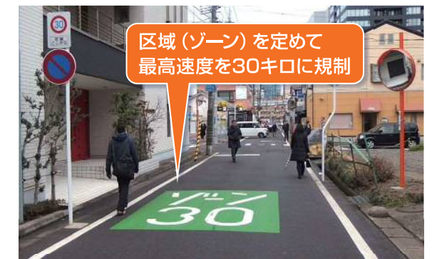
ゾーン30 (中央区・米山)