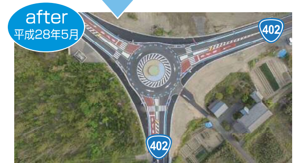
国道402号のラウンドアバウト (角田浜交差点)