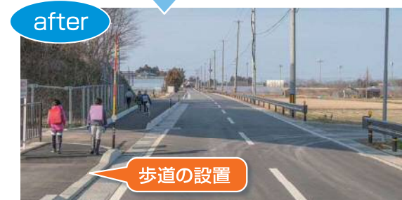
歩道設置 (秋葉区・新関小学校)