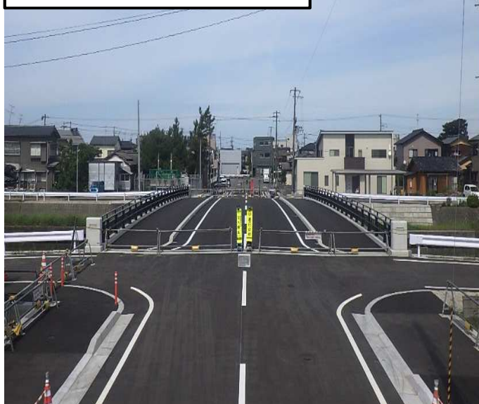
写真 2 (新橋 土地亀橋)