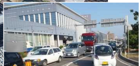
▲ 渋滞により物流活動を阻害 (万国橋交差点付近)