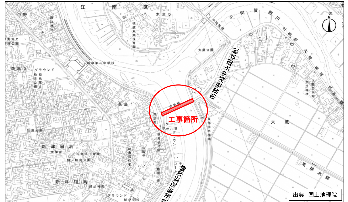
*** 大島橋 車道片側交互通行規制及び片側歩道通行止め規制 ***