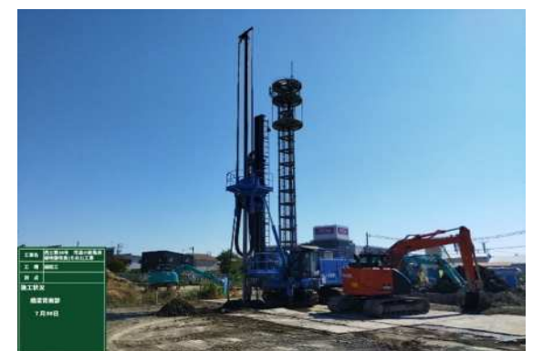
写真：小新亀貝線での地盤改良工事実施状況