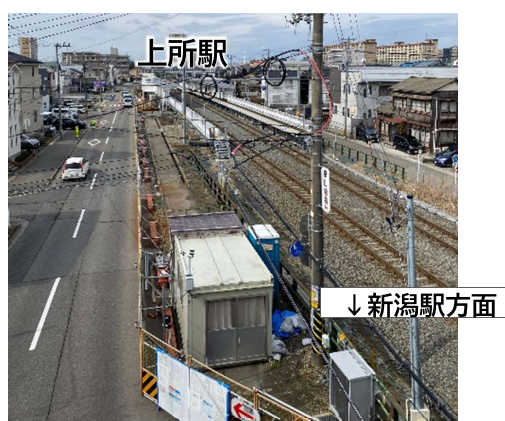
駅南側歩道の通行規制状況