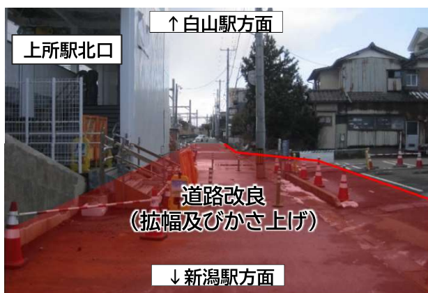
駅北側道路改良工事のイメージ