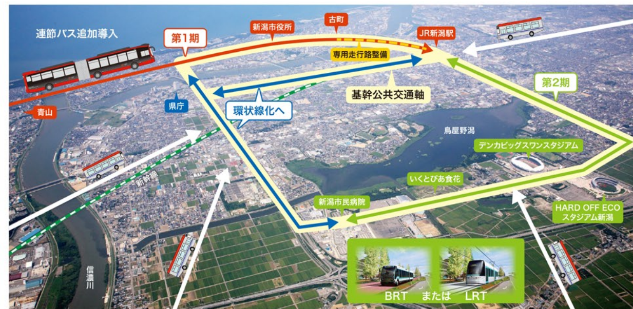
■今後の展開イメージ