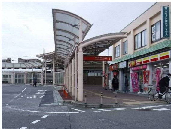
写真 6-15 JR 白山駅