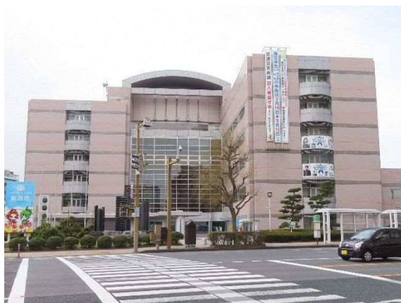
写真 6-17 新潟市役所