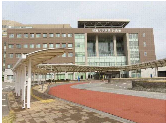
写真 6-16 新潟大学医歯学総合病院