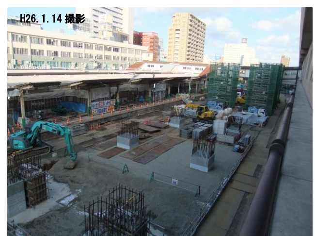
写真4 新潟駅の工事状況（旧5・6・7番線）