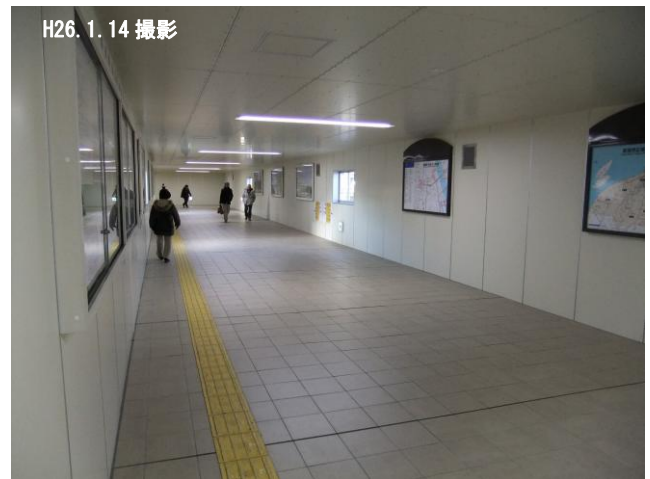
写真2 東側仮連絡通路の内部