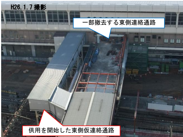
写真1 東側仮連絡通路の工事状況

新潟駅においては、平成25年6月25日（火）から西側仮連絡通路の供用を、平成25年10月27日（日）から東側仮連絡通路の供用を開始しました。これは、既存の連絡通路の位置では今後の施工に支障することから、仮の連絡通路に切り替えました。新潟駅の高架化後（平成33年度以降）には、再び元の位置に西側連絡通路と東側連絡通路を整備する予定です。また、旧5・6・7番線では、ホームや線路の撤去を行い、高架駅舎の杭や柱などの工事を行っています。新潟駅以外の工事状況については、当事務所のホームページをご覧ください。