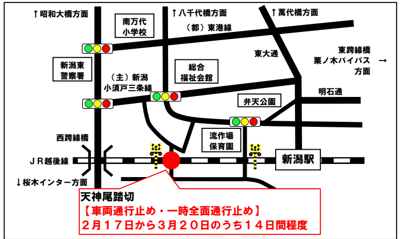
図1 天神尾踏切付近交通規制

近隣の皆様や道路利用の皆様にはご不便をおかけいたしますが、ご理解とご協力をお願いいたします。