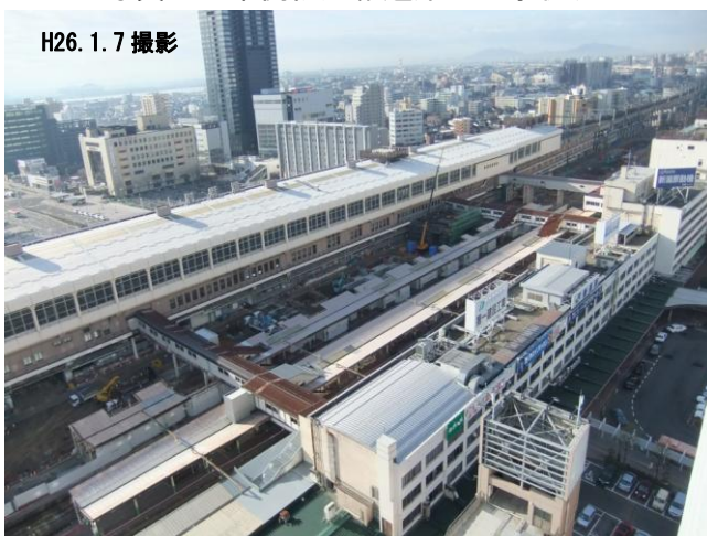
写真3 新潟駅の工事状況（上空から）