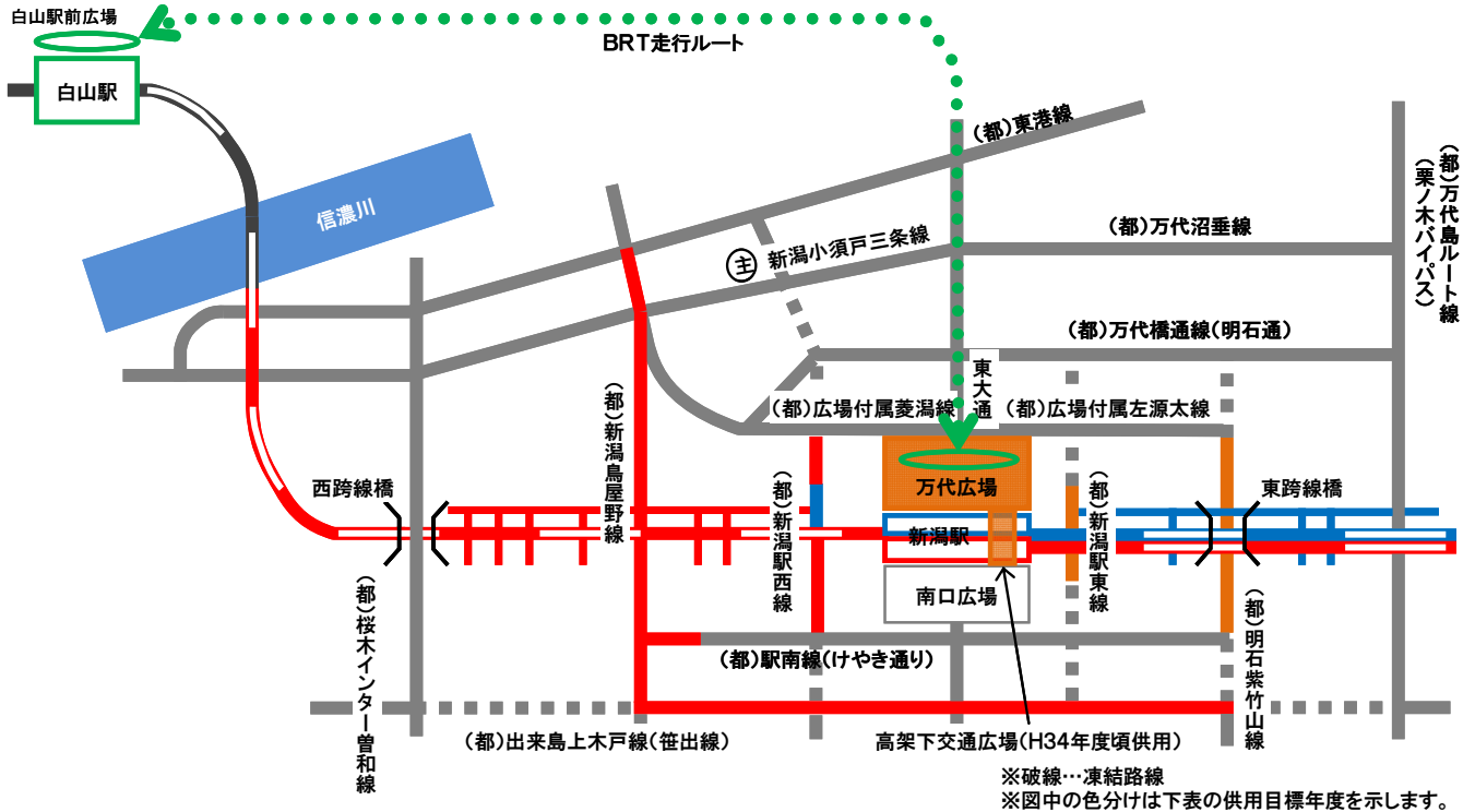
供用目標スケジュール

新潟駅付近連続立体交差事業では、着手後概ね5年が経過した事から、現状を踏まえJR東日本とともに工程精査を進めてきました。今後は、道路や広場整備も合わせ新たな整備目標に取り組みます。