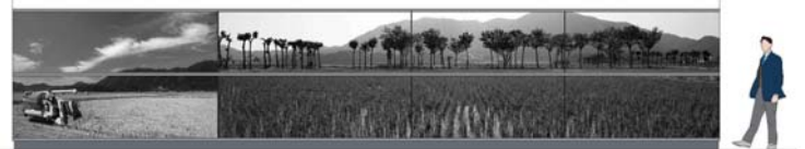
南口広場側面（西側）