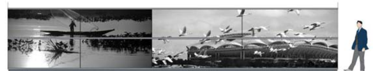
南口広場側面（東側）