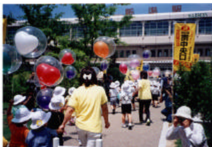
参加者による通り初め

利用時間は、新幹線の始発から最終までの時間帯です。 車椅子を利用している方は、今まで通りエレベーターが設置してある西側連絡通路をご利用ください。 南口広場からの通路は、歩行者専用通路となっていますので、自転車の乗り入れはできません。