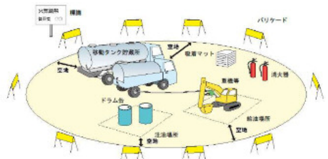
移動タンク貯蔵所等による給油、注油等の安全対策の例