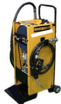
緊急用手動ポンプ