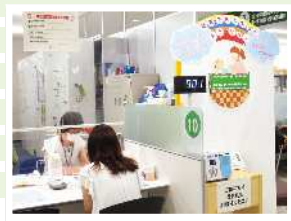
▲ほっとステーション北区