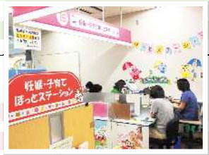
▲ほっとステーション秋葉区

小学校就学以降は、生きる力を育むことを目指し、調和のとれた発達が図られる時期です。学校での学習を中心に、学力の基礎を養うとともに、健やかな心と体の育成に努めましょう。