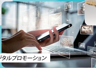
デジタルプロモーション