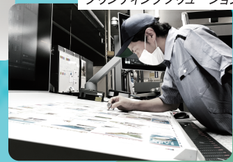
プリンティングソリューション