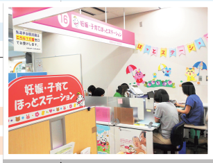
▲ほっとステーション秋葉区

小学校就学以降は、生きる力を育むことを目指し、調和のとれた発達が図られる時期です。学校での学習を中心に、学力の基礎を養うとともに、健やかな心とからだの育成に努めましょう。