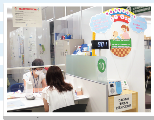
▲ほっとステーション北区