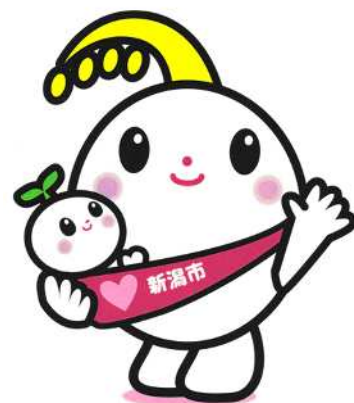
新潟市子育て応援 キャラクター ほのわちゃん