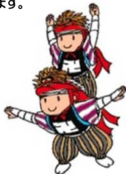
月潟の伝統芸能 角兵衛獅子

それぞれチラシ、ポスター、ホームページなどで参加者を募集します。多くの方々のご参加をお待ちしています。