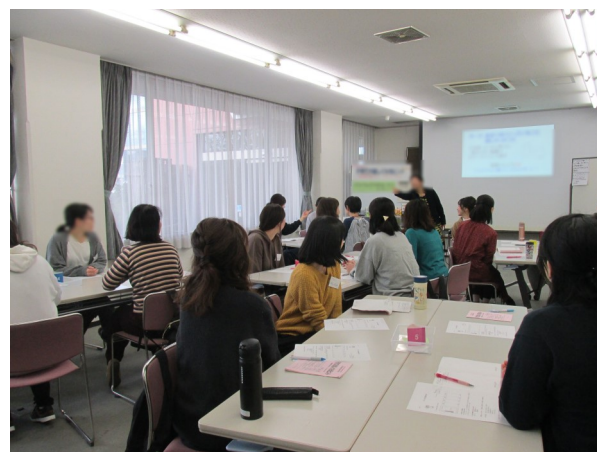
これまでの講座の様子

今年度は広い会場で行い、飛沫感染予防のために各テーブルにはアクリル板を設置します