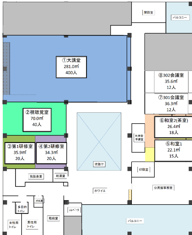
平面図（北区役所3階）