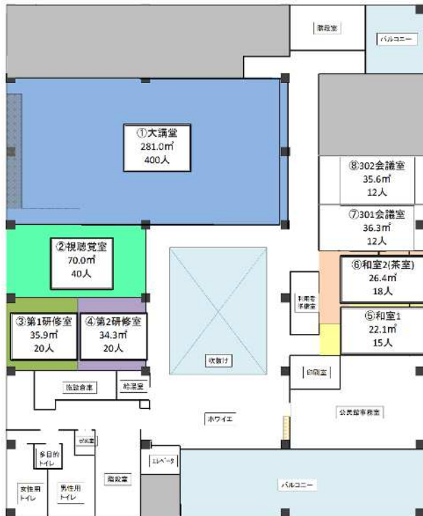
平面図（北区役所3階）