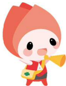
新潟市防災マスコットキャラクター キョージョ