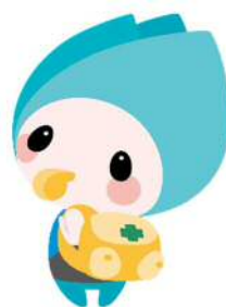
新潟市防災マスコットキャラクター ジージョ