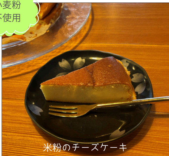
米粉のチーズケーキ