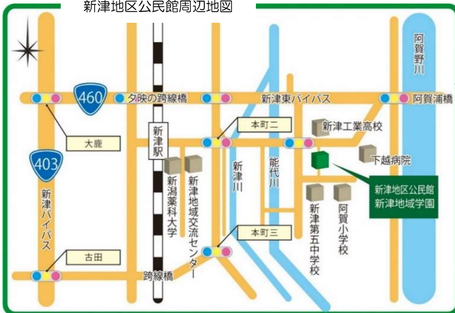
新津地区公民館周辺地図