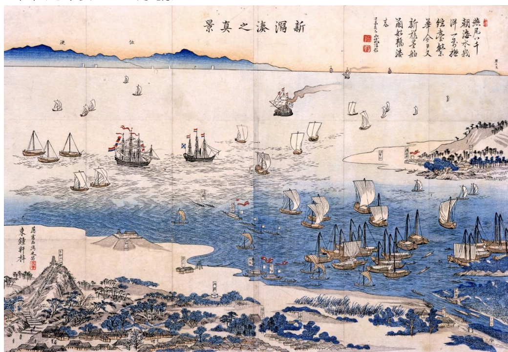
「新潟湊之真景」