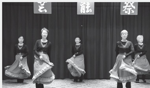
令和7年 小須戸地区芸能祭での出演の様子

日時 5月19日(火) 10時~11時半 会場 小須戸まちづくりセンター 3階 ホール 内容 レクダンス 持ち物 動きやすい服装、靴、タオル、飲み物 講師 錦織先生 補助 レク・あじさい