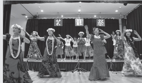
令和7年 小須戸地区芸能祭での出演の様子

日時 5月12日(火) 10時15分~11時45分 会場 小須戸まちづくりセンター 3階 会議室 内容 フラダンス 持ち物 動きやすい服装、靴、タオル、飲み物 講師 フラサークルオーキッドのみなさん