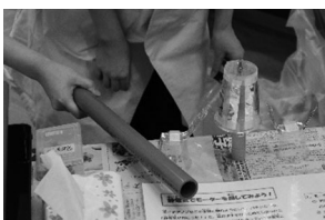
電極に近づけるとカップがくると回転しました

8月25日(水)と26日(木)の両日に小須戸まちづくりセンターと小須戸地区ふれあい会館で新潟薬科大学学生ボランティアの協力で「やってみよう科学実験」を実施しました。 今年の実験テーマ「静電気モーターを回してみよう」では、はじめに大きいプラカップにアルミ箔の帯をはり、続いて、カップの底に画びょうで回転部分を作り、最後に、小さいプラカップにアルミ箔とクリップで電極を作りました。完成後、紙でこすった塩パイプを電極に近づけることでプラカップが回転し、静電気の流れを目で見ることができました。