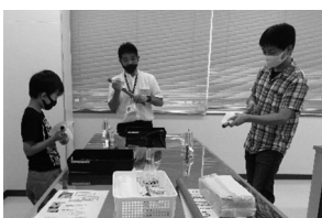
塩パイプを一生懸命こすって静電気を発生させます