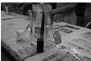
完成した静電気モーターの写真