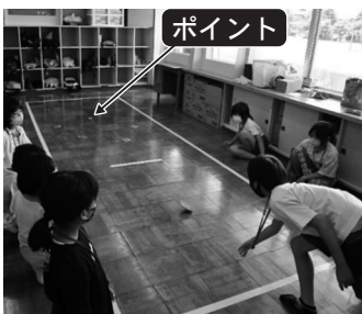
黄色いポイントを狙ってディスクを投げる参加者

8月5日(木)に、連日「熱中症警戒アラート」が発令される程の猛暑のため、小学校体育館から小須戸ひまわりクラブの教室に急ぎよ会場を変更して、カーリンコンを楽しみました。